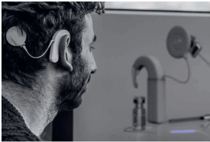
Träger eines klassischen Cochlea-Implantats vor einem optischen Cochlea-Implantat mit optischer Faser (blau).

hochgradigem Hörverlust oder Taubheit eine Hörwahrnehmung wiederherstellt. Mikrofone an der Außenseite des Geräts wandeln Schall in elektrische Signale um, die dann direkt den Hörnerv in der Cochlea stimulieren. Diese Struktur im Innenohr wandelt die Schallinformationen in Nervenimpulse um und sendet sie an das Gehirn. Obwohl Cochlea-Implantate sehr erfolgreich bei der Wiederherstellung des Sprachverständnisses in der Stille sind, ermöglicht ihre begrenzte spektrale Auflösung nur sehr eingeschränkt das Verfolgen von Gesprächen bei Umgebungsgeräuschen und limitiert den Musikgenuss.