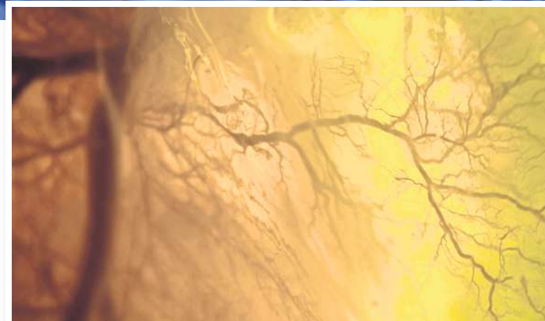
Mithilfe verschiedener Mikroskope und bildgebende Verfahren können Besucher Zellen und Gewebe untersuchen.

Wie schon bei anderen Ausstellungen sei es auch dieses Mal eine Herausforderung, den Spagat zwischen Fachleuten und themenfremden Menschen aus der Gesellschaft zu meistern, sagt Conrad. „Wir mussten uns klar machen, wer eigentlich unsere Zielgruppen sind“, ergänzt Moser: „Wir hoffen, dass sich durch die Ausstellung auch junge Menschen für Forschung begeistern.“ Dafür soll es zahlreiche weitere Aktionen geben: